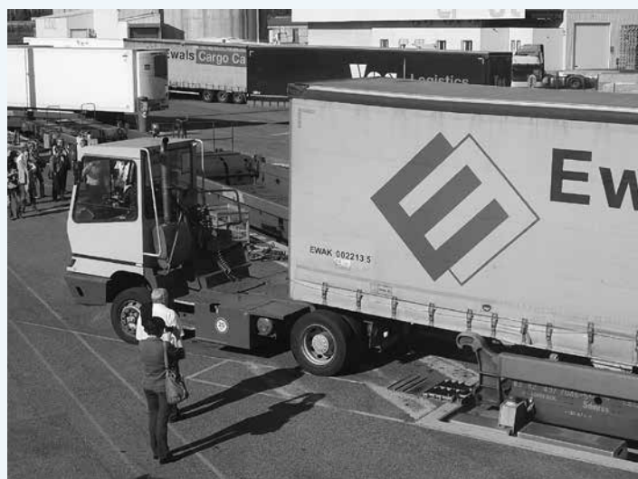
Technologie Modalhor - wagon à plancher pivotant permettant le transport de toutes les semi-remorques standards